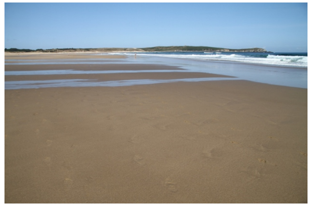
Praia de Valdoviño coa marea baixa.

É posible facer este percorrido en tramos separados: a punta Frouxeira, a praia ou a lagoa.