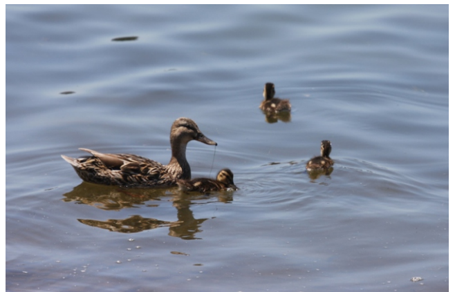
Femia de lavanco coas crías.

Unha camiñada na que se combinan diferentes ambientes e ecosistemas: praia e dunas, cantís e monte baixo, e a lagoa cos seus hábitats asociados. Paisaxes diferentes e fermosas panorámicas que non deixan indiferente... a longa praia, horizontal e dourada, os cantís cortados a pico e con numerosas formas creadas por séculos de loita co mar, e unha das lagoas de máis extensión de Galiza; e ver de preto unha vexetación adaptada entre a que se atopan especies pouco comúns ( Antirrhinum majus , Smilax aspera ou silva do mar, Asparagus officinalis ou esparragueira, o xunco Cladium mariscus ....) dentro dun espazo protexido como LIC COSTA ÁRTABRA no que a Lagoa e areal de Valdoviño son Zona Húmida de Importancia Internacional recoñecida no convenio de RAMSAR, e ZEPA (Zona de Especial Protección para as Aves) pola súa importancia como zona de paso e invernada de numerosas especies de anátidas e limícolas das que chegan a contabilizarse ata 15.000 exemplares.