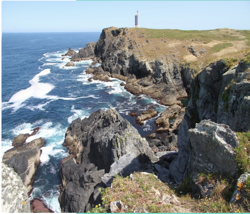
Cantís e faro da Punta Frouxeira.