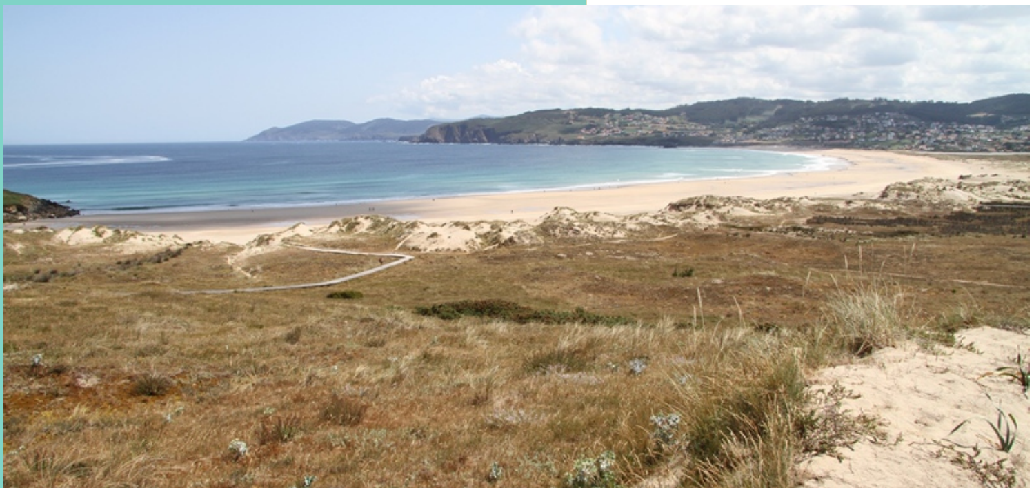
Dunas e praia de Valdoviño