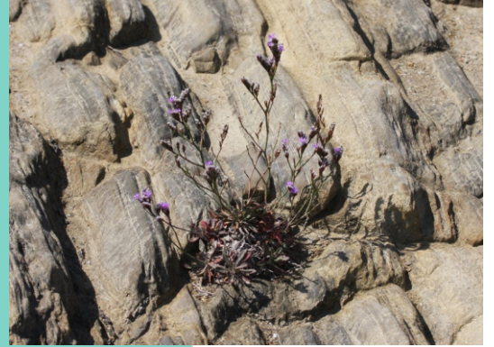
Herba salgada ( Limonium binervosum )