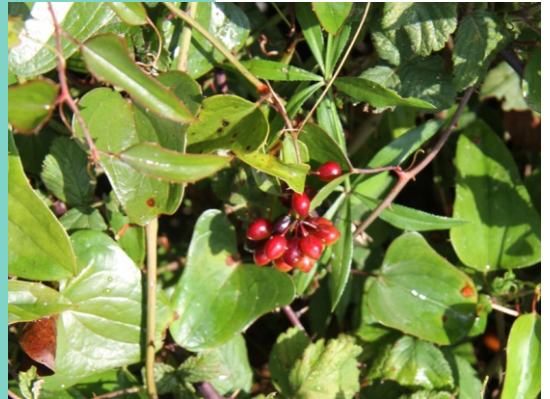
Silva do mar ( Smilax aspera )