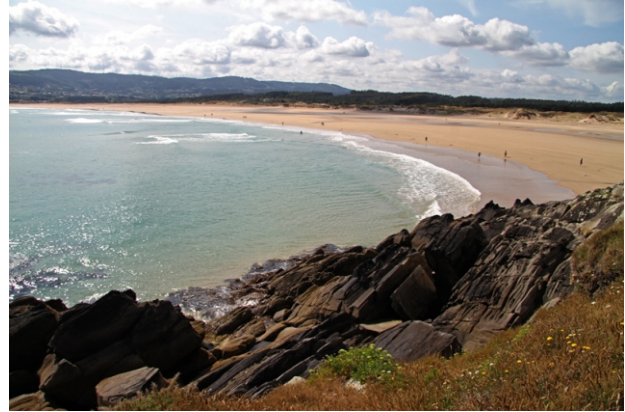
Praia de Valdoviño desde a Punta Frouxeira.