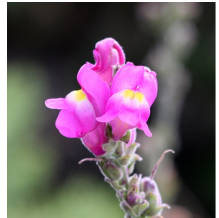
Antirrhinum majus , unha planta incluída no catálogo de especies ameazadas. Común neste espazo.